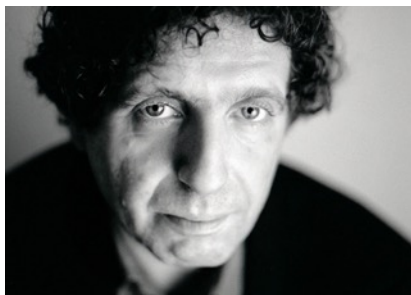
-MICHAËL LEVINAS, MUSIQUE ET LIVRET

« Il s'agit de ma première écriture lyrique commandée en son temps par la Biennale de Paris suite à une nuit de France Musique consacrée au thème des oiseaux.